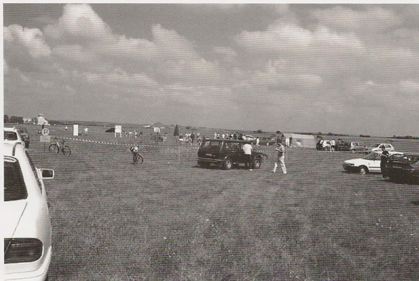
Vršac 2009. Srpski FK turnir

Sve ovo, kao i mnogo drugih informacija, može se videti na klupskom sajtu čija je adresa: http://www.srpskiklubprevrtaca.org.rs/