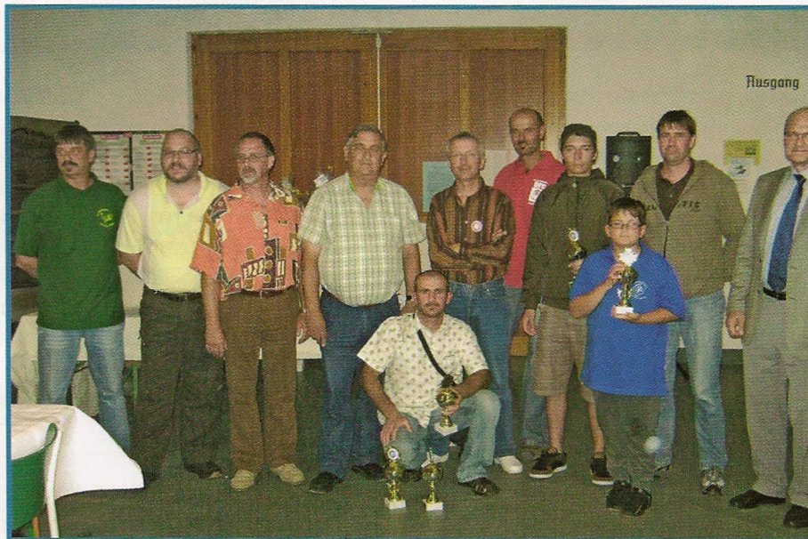
Hofheim 2009. Nemački FK turnir