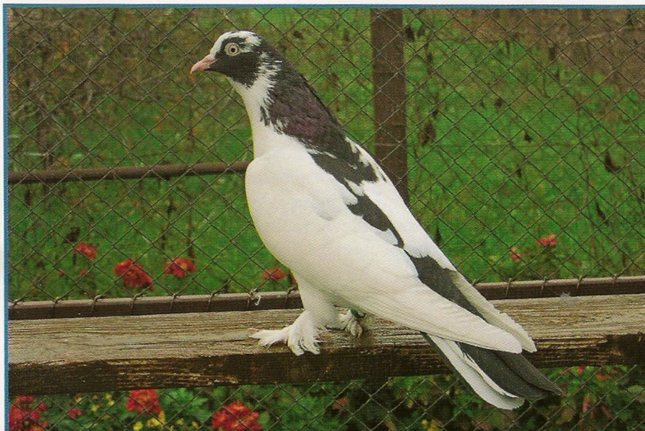
Kelebek - ženka

Termin 2009 SKP FK Turnir 13. - 14. Avgust Vršac - JAT aerodrom