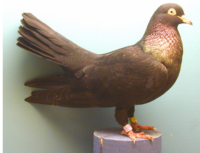
Orientalische Roller: Foto: Tögel Helmut F.

Viele dieser Taubenrassen zeigen etliche dieser Flugkünste in Kombination. Es gibt auch Rassen, die man nicht nach diesem Schema genau einteilen kann, weil die Vielfalt der gezeigten Flugformen derart ungewöhnlich sind dass eine Einteilung kaum vorgenommen werden kann.