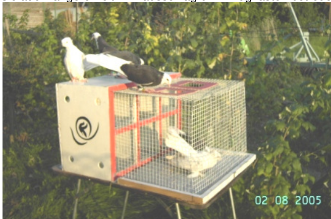
Flugkasten mit Sitzgelegenheiten

Kunstflugtauben kann man auch von transportablen Kästen aus starten lassen. Solche Tauben werden also zunächst nicht von einem feststehenden Schlag aus aufgelassen. Sie sind zwar im üblichen Schlag untergebracht, werden aber zum Flug in kleine, kistenförmige Schläge getan, irgendwohin mitgenommen und dort aufgelassen. Sie kehren sicher zu ihrem transportablen Schlag wieder zurück. Ein wechselseitiges Abfliegen vom Heimatschlag bzw. Flugkasten ist erst dann möglich, wenn die Roller fest auf dem Flugkasten eingewöhnt sind, der Züchter auch über ausreichende Erfahrungen verfügt. Durch diese ungewöhnliche Möglichkeit des Flugtaubensports kann man auch auf kleinsten Raum, etwa in der Großstadt auf einem Balkon, Flugtauben halten. Zum Flug bringt man sie mit dem Flugkasten einfach ins offene Gelände und frönt hier seinem Steckenpferd. Kunstflugtauben müssen nicht täglich fliegen. Zu Schlechtwetterzeiten oder während des Urlaubs kann man sie auch längere Zeit im Hausschlag bzw. Flugkasten betreuen.