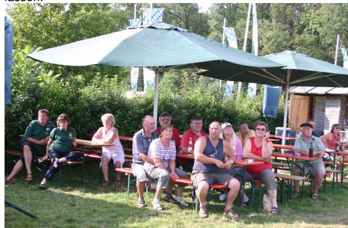
Flugkastenmeisterschaft ist angesagt:

Im allgemeinen fliegen Truppenflieger nur einmal am Tag ihre Flugzeit hindurch. Soloflieger nach Art der Drehtauben beispielsweise kann man mehrmals hintereinander fliegen lassen.