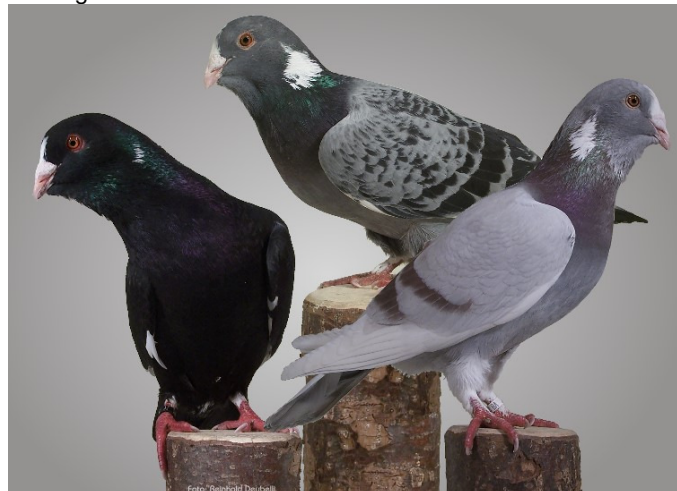
Syrische Wammentauben, Sturzflugtauben, Foto: Deubelli

Kunstflugtauben entstammen vorzugsweise dem Klein- und zentralasiatischen Raum u. sie waren Ausgangsrassen für fast alle bekannten Haustaubenrassen. (Immerhin 3000 Rassen) Kunstflugtauben sind außerordentlich vitale, wetterfeste, widerstandsfähige und vermehrungsfähige Tauben, die den heutigen Ausstellungsrasen bezüglich ihrer Härte weit überlegen sind.