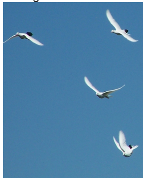
Pfeifentauben im Flug

Wegen gleicher Erbanlagen ist es besser, aus einer Hand 5 Tiere zu erwerben, als von 4 verschiedenen Züchtern 10 Tiere! Nur von renommierten Züchtern sollte man seine Tiere erwerben. Achten Sie daher auf die Flugergebnisse, die im Fachorgan des DFC der „Kunstflugtaube« veröffentlicht werden. Viele Interessenten scheitern daran, weil ihnen minderwertige Tauben angeboten werden —oft verlockenden Anzeigen in Fachblättern.